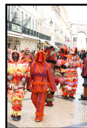
Masques de Vila Boa d'Ousilhão

Fruit d'un long travail mené par les permanents et les bénévoles de l'Association Nationale Cultures et Traditions tout au long de l'année, le Festival est la manifestation phare de l'association. Toujours à la recherche de l'inédit et grâce à son réseau de coopérations internationales, l'association mène un travail considérable de recherches et de rencontres pour créer chaque année une programmation originale, riche et diversifiée.