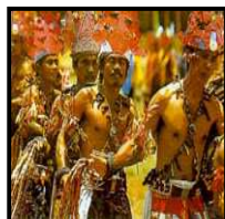
Les Dayaks de Bornéo, Indonesie

Depuis 1974, le Festival les Cultures du Monde de Gannat fondé par Jean Roche ouvre ses portes sur un voyage à travers les cinq continents et les peuples du monde. La ville de Gannat en Auvergne devient pendant dix jours le théâtre de 400 artistes venus du monde entier afin de partager avec plus de 65 000 visiteurs les danses, musiques et couleurs de leurs pays, et de le sensibiliser à la fragilité de ce patrimoine culturel immatériel.